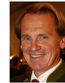
Markus Wasmeier Olympiasieger, Museumsleiter Bauern- hofmuseum Schliersee