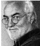
Sebastian Huber Autor