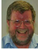
Ernst Schusser Volksmusikarchiv des Bezirks Oberbayern